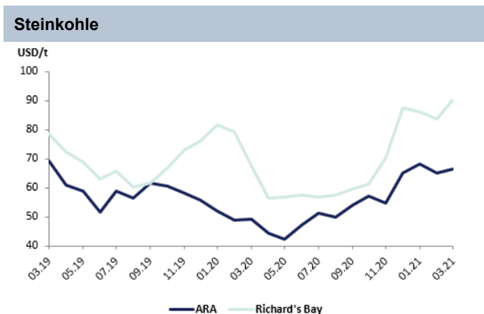
API#2 Index, 1m Future, ARA (Europa), CIF; Richard's Bay (Südafrika), 1m Future