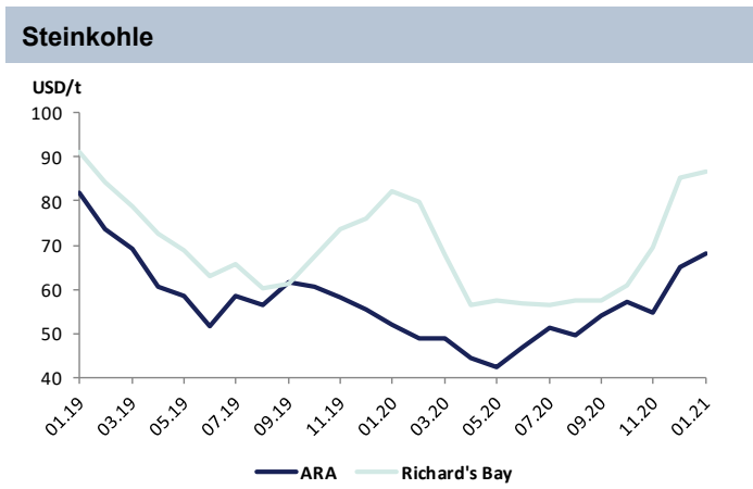
API#2 Index, 1m Future, ARA (Europa), CIF; Richard's Bay (Südafrika), 1m Future