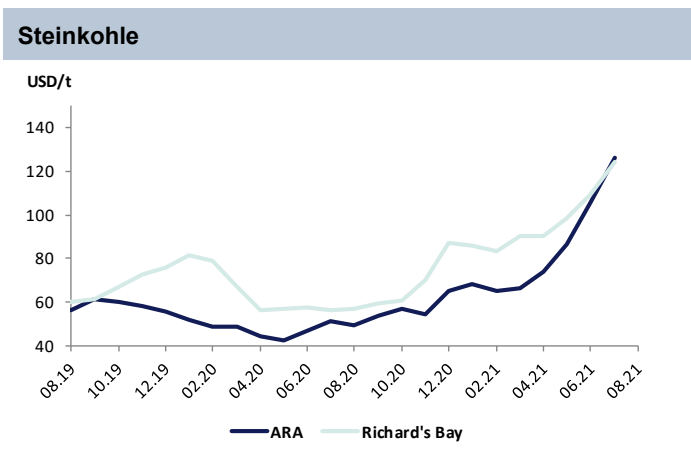
API#2 Index, 1m Future, ARA (Europa), CIF; Richard's Bay (Südafrika), 1m Future