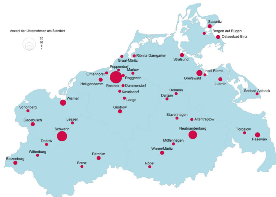
Abb. 3: Standorte der 100 mitarbeiterstärksten Unternehmen

Wie in den Vorjahren ist in den beiden kreisfreien Städten des Landes das Dienstleistungsgewerbe stark vertreten. In diesem Sektor nimmt Rostock mit sieben Notierungen die führende Position ein. Zudem verfügt Rostock über fünf große Unternehmen aus dem Bereich Verkehr und Nachrichtenübermittlung sowie vier große Unternehmen des Verarbeitenden Gewerbes. Zwei Kreditinstitute sowie jeweils ein Energie- und Wasserversorger und ein Vertreter der Gesundheitswirtschaft runden den Branchenmix der Hansestadt ab. Auch in Schwerin ist das Dienstleistungsgewerbe mit sechs Notierungen großer Unternehmen quantitativ am stärksten vertreten, während das Verarbeitende Gewerbe, das Kreditgewerbe und der Bereich Energie- und Wasserversorgung durch jeweils zwei Unternehmen repräsentiert werden. Außerdem ist Schwerin Standort je eines großen Unternehmens aus dem Bereich Verkehr und Nachrichtenübermittlung sowie Handel.