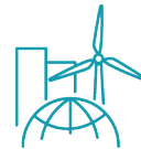
Energie & Infrastruktur